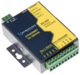
Ethernet - Soros