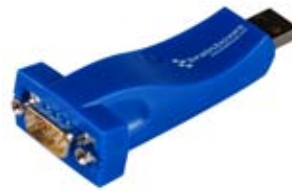
USB dla komputerów stacjonarnych