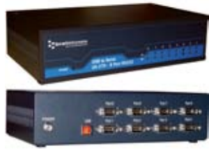
USB dla przemysłowych urządzeń szeregowych